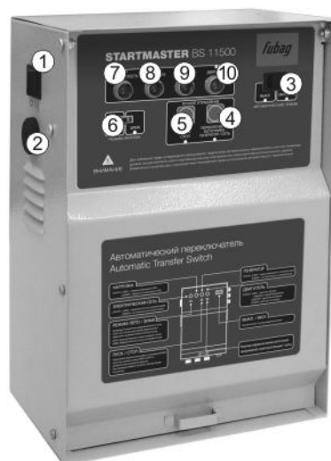
Startmaster BS 11500